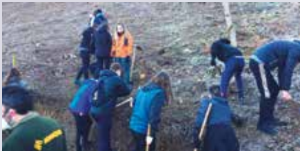
Xabier Munibe ikastolak Eskola Agenda 2030 programan parte hartu du aurten