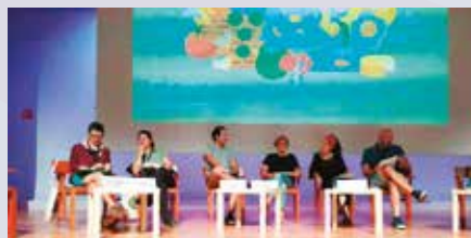
Beasaingo Murumendi ikastetxeak GOZO II Jardunaldietan parte hartu du