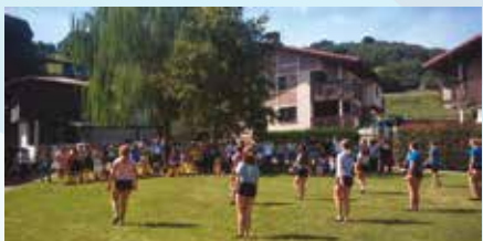
Larraulgo Eskolaren inaugurazio hunkigarria