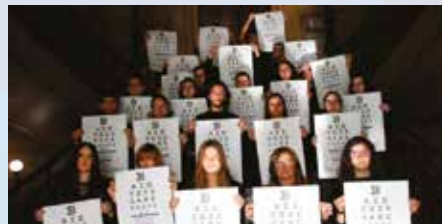
Usandizaga Institutuko diseinu ikasleak Genero indarkeriaren aurkako Nazioarteko Egunaren aldeko kanpainako protagonistak