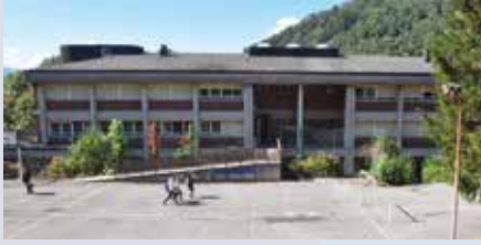
Orixek Tolosaldearen aniztasuna lantzen du ikasturtean zehar