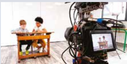
Anzuolako eta Arrasateko ikasleek Hara, bi! programan parte hartuko dute.