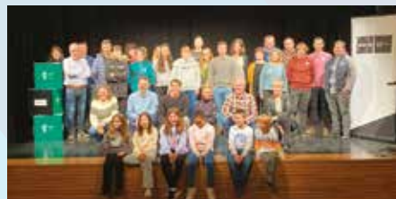
Aurkeztu dute Ikastetxe-Klik, Debagoieneko ikastetxeetan energia aurrezpena sustatzeko proiektua