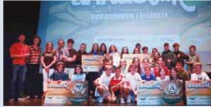
Azpeitiko Karmelo Etxegarai ikasleak saritu dituzte Arnasetik bideosormen lehiaketan