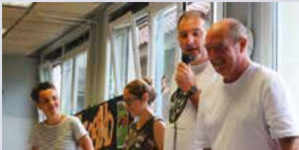
Bertso-bazkaria Elizalde Herri Eskolan