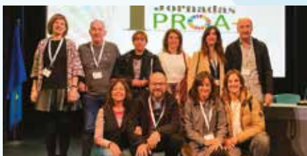
Cantabriako antolatutako estatu mailako I. PROA+ jardunaldietan parte hartu du Elgoibarko Herri Eskolak