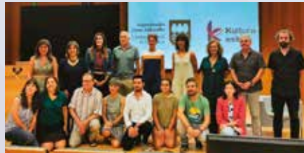
Kurtzebarri BHI, 'Kultura Eskola' jardunaldira gonbidatua