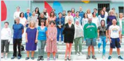
Altza herri ikastetxea mende erdiko bizia ospatzen ari da