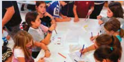
Samaniego eskolako ikasleriak birziklapenaren bidez hiria irudikatzen du