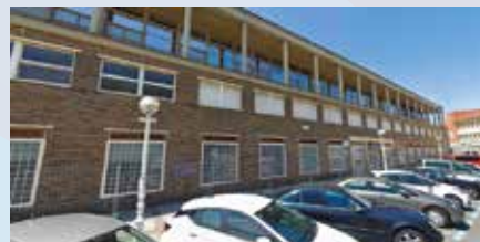
Manteo institutua adin txikikoen babesgabetasuna prebenitzeko zerbitzuetan sartu dute