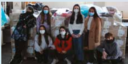
Donostiako Arantzazuko Amako ikasleak, boluntariatzen murgilduta