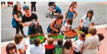
Barazki-azoka Berastegiko Muñagorri eskolako patioan