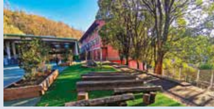
Jolaserako natur-parke bat eraiki dute Elgoibarko Herri Eskolako patioan