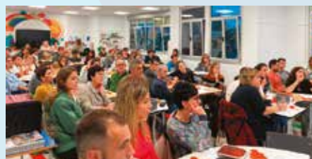
Familiantzako matematika tailerrak Orokieta herri eskolan