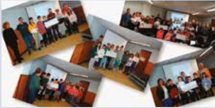
Orasoaldeko lau ikastetxe saritu dituzte 50/50 Proiektua dela eta