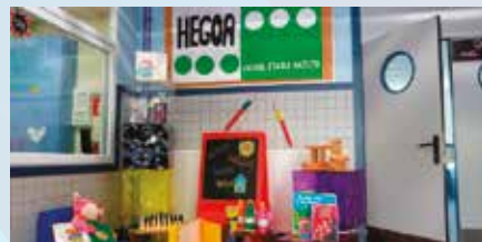
Intxaurrondo Hegoa Eskola, euskara-ingelesa hizkuntzalaritzan murgildurik