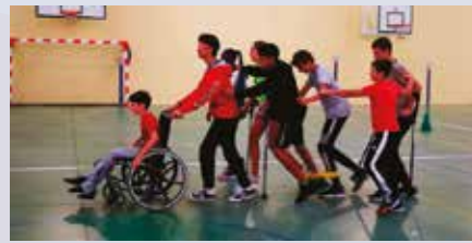
“Desberdintasuna bizitzea” sentsibilizazio-jardunaldiak Zaragueta eskolan