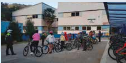
Ikastetxeen karabana Tolosan ibiltzen hasi da udaltzainen zuzendaritzapean