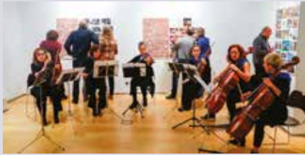
Ipintza Institutuaren 50 urteko ibilbidea, irudietan