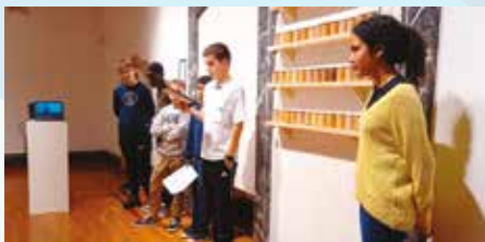
Ni, Zu, Gu, proiektua Mutrikuko institutuan bizikidetza lantzeko