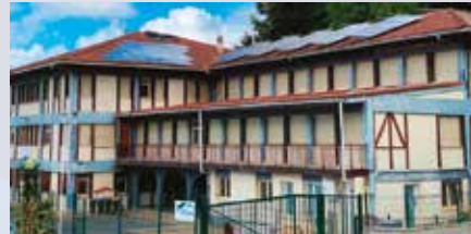
Getariako Udalak Iturzaeta ikastetxe publikoaren teilatuan eguzki-panelak jarri ditu